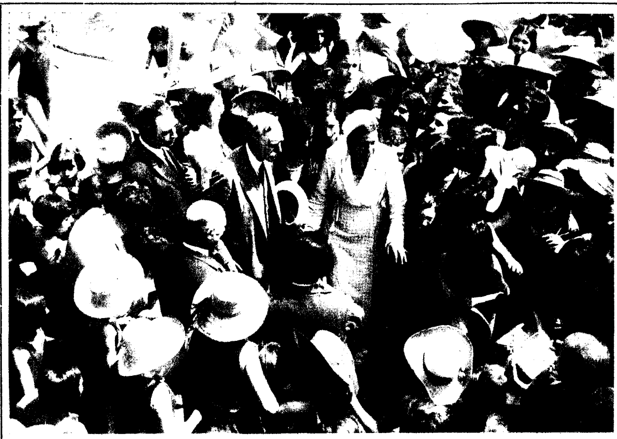
El señor Maciá, presidente de la Generalidad, rodeado de niñas durante su visita a la Escuela de Mar