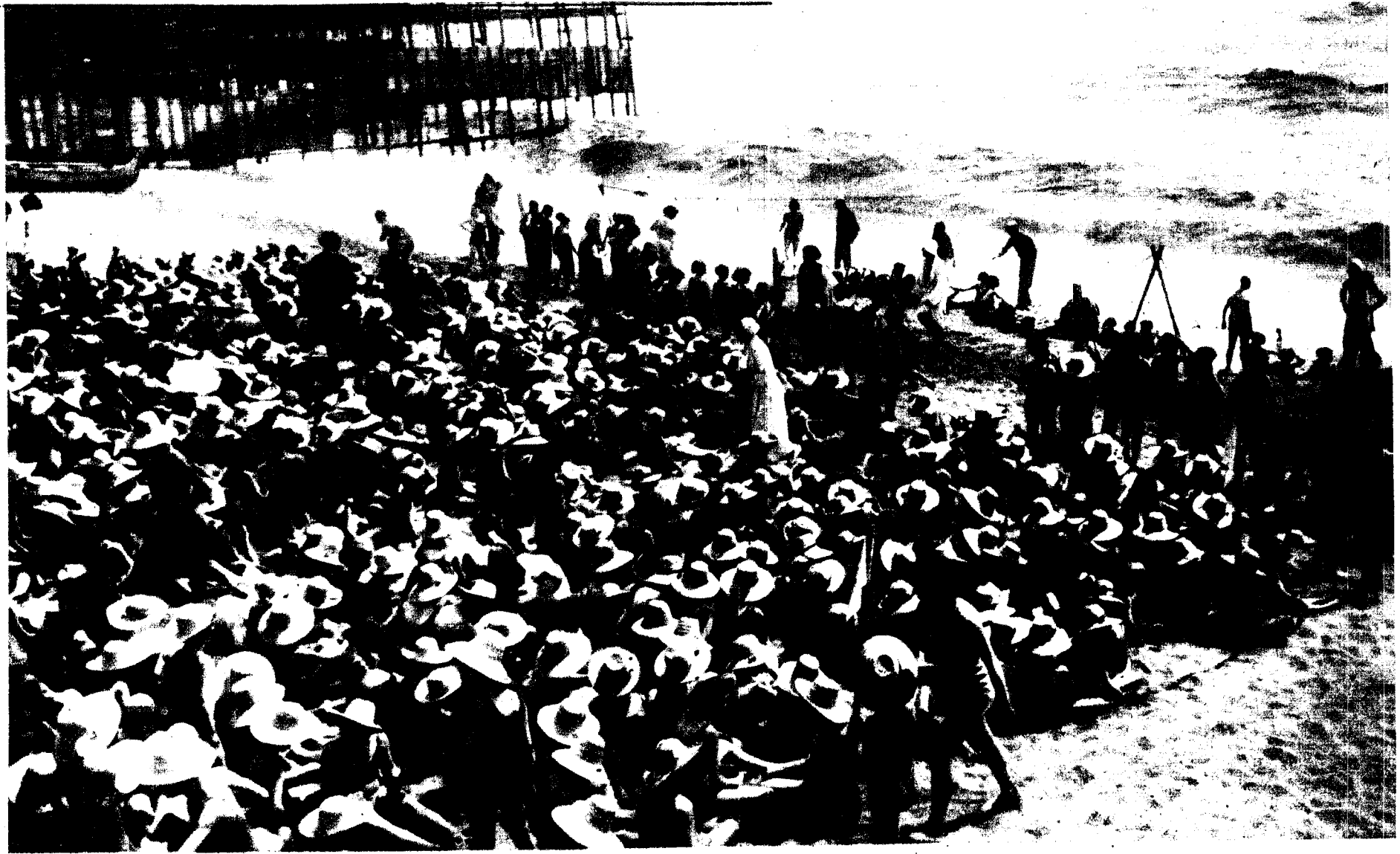
Un aspecto de la playa de la Escuela de Mar, durante las horas de calor