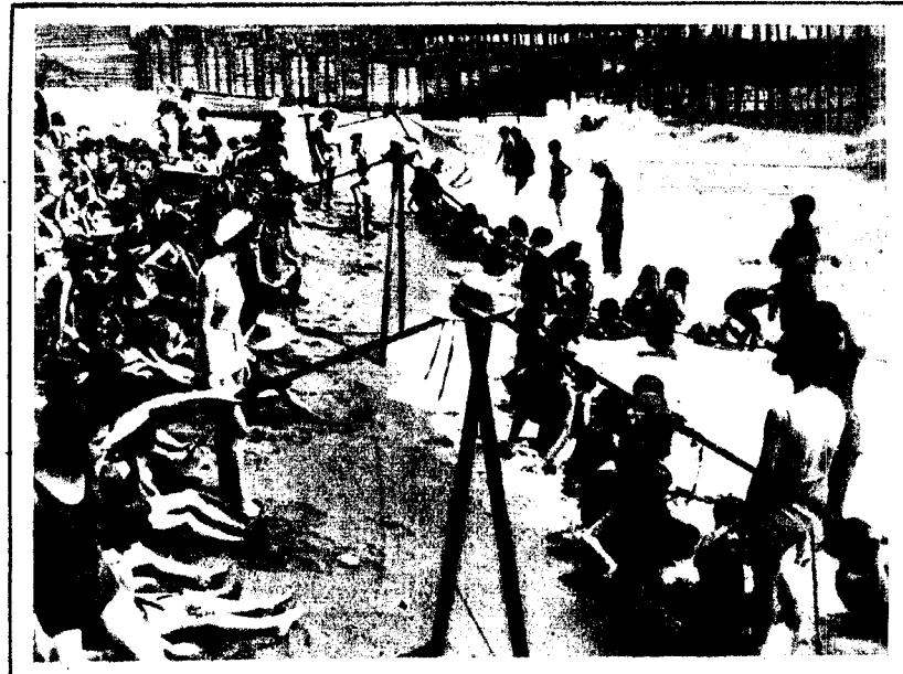
La hora del baño en la Escuela de Mar de la Barceloneta