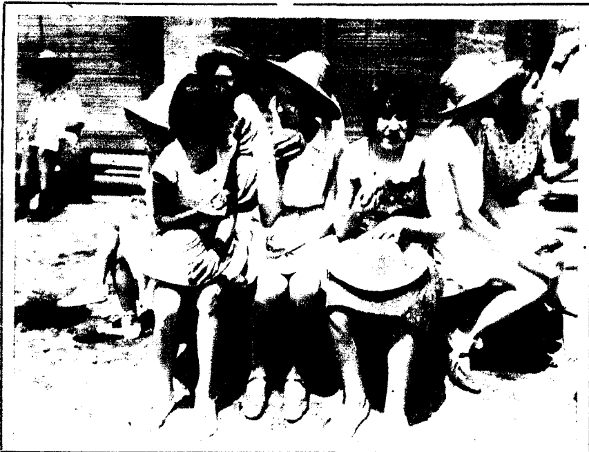
Niñas de las Colonias Escolares después del baño en la playa de la Escuela de Mar, que posee el Ayuntamiento en la Barceloneta